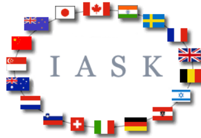
International Association of Specialized Kinesiologist

La U.P.Bioetica è impegnata a formare i Kinesiologi Specializzati. Contattaci ora!