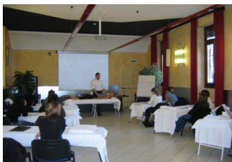
Allievi impegnati in una lezione frontale full immersion che prevede una notevole parte di pratica guidata dal docente.

I corsi sono ampiamente flessibili ed offrono quindi la possibilità di frequenza a persone adulte che svolgono già un'attività lavorativa.